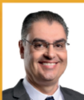
Lafayette de Andrada Deputado Federal