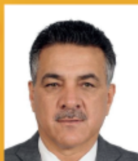
Emidinho Madeira Deputado Federal

A união entre Klebinho e Marquinho e nossos deputados federais e estaduais, juntamente com nossos vereadores, é a garantia de que teremos uma liderança bem conectada e capaz de trazer recursos e soluções para nossa cidade.